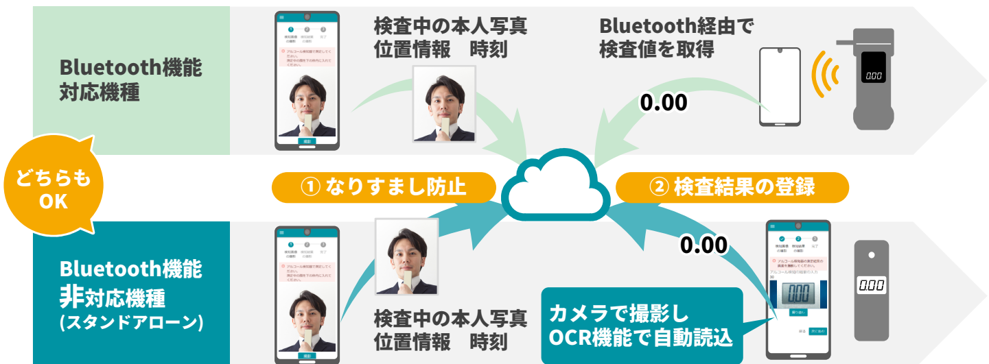
運転者のアルコールチェックの流れ