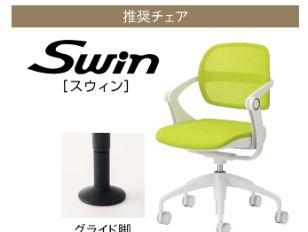
推奨チェア グライド脚

サイレントブース コンセントレーションブース コードホール 本体背面のコードホールから配線処理が可能です。