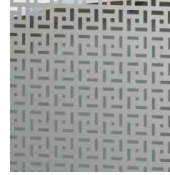
パンチングパターン