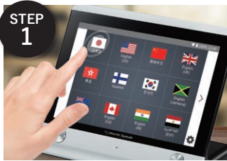
使用したい言語をタッチします。