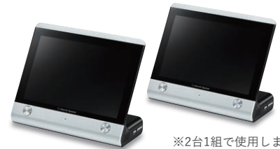
※2台1組で使用します。