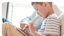
大手学習塾・通信教育