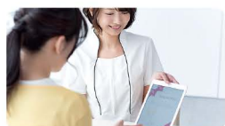
化粧品・美容部員