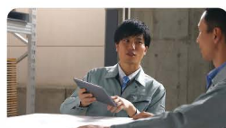
鉄道・航空・物流