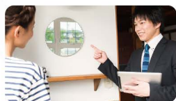
建築・インテリア