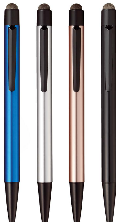
単色ボールペン&タッチペン SXNT82-350-07 1P